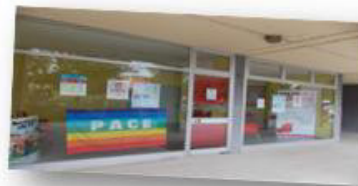
La nostra sede di via Veneto 23