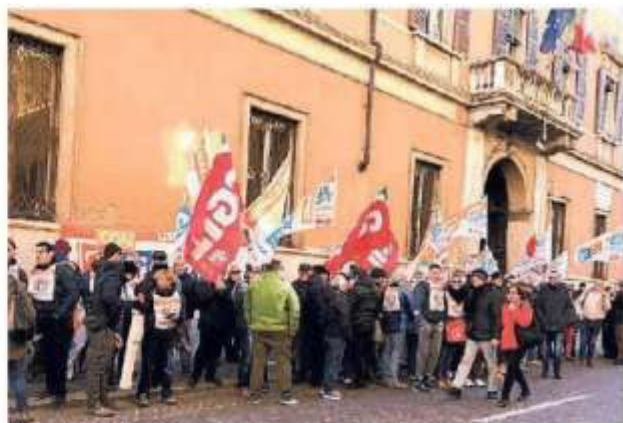
Il presidio della Cgil davanti alla prefettura di via Principe Amedeo

I sostenitori dei due Sì referendari hanno inoltre chiesto che la data del voto coincida delle elezioni amministrative, che coinvolgerà mille comuni italiani (otto a Mantova). «Ab-